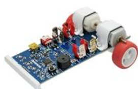
〈マイコンレーサー車〉