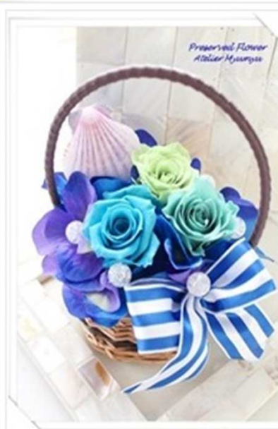
サマーバスケット