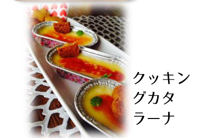
クッキン グカタ ラーナ