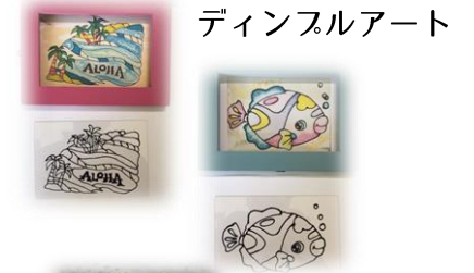
ディンプルアート