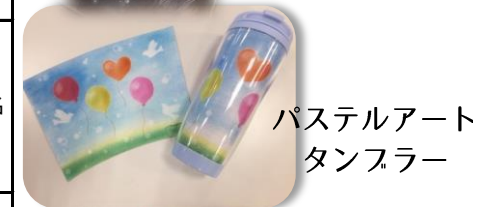
パステルアート タンブラー