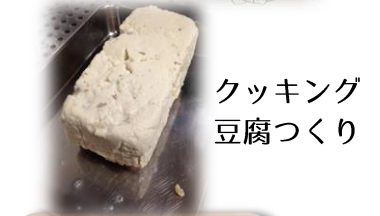
クッキング 豆腐づくり